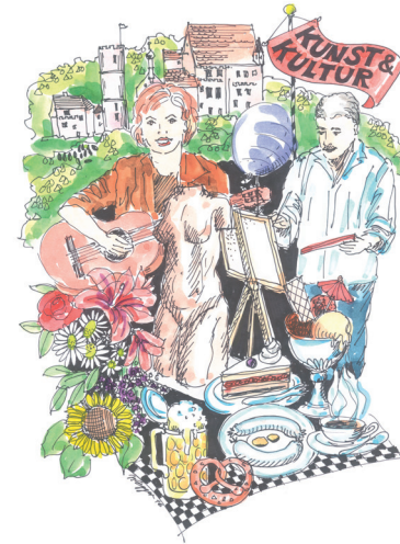
Zeichnung: Isolde Egger